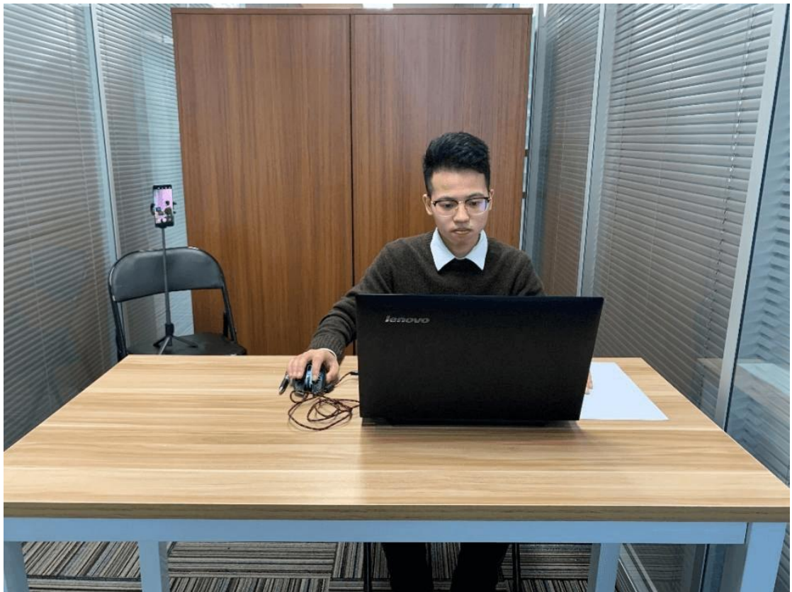
图一：电脑端备课正面视角

同时应在面试坐姿的后侧面设置合适的放置移动端设备（手机或平板）的位置，保证移动端设备能够从后侧面拍摄到考生桌面、笔记本电脑屏幕、周围环境及考生考试全过程。