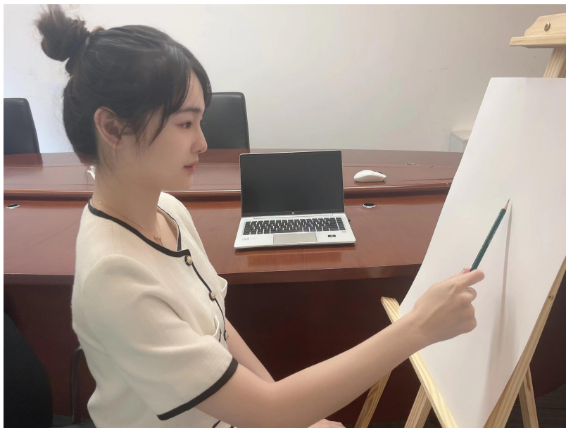
图四：画架画板摆放示意图