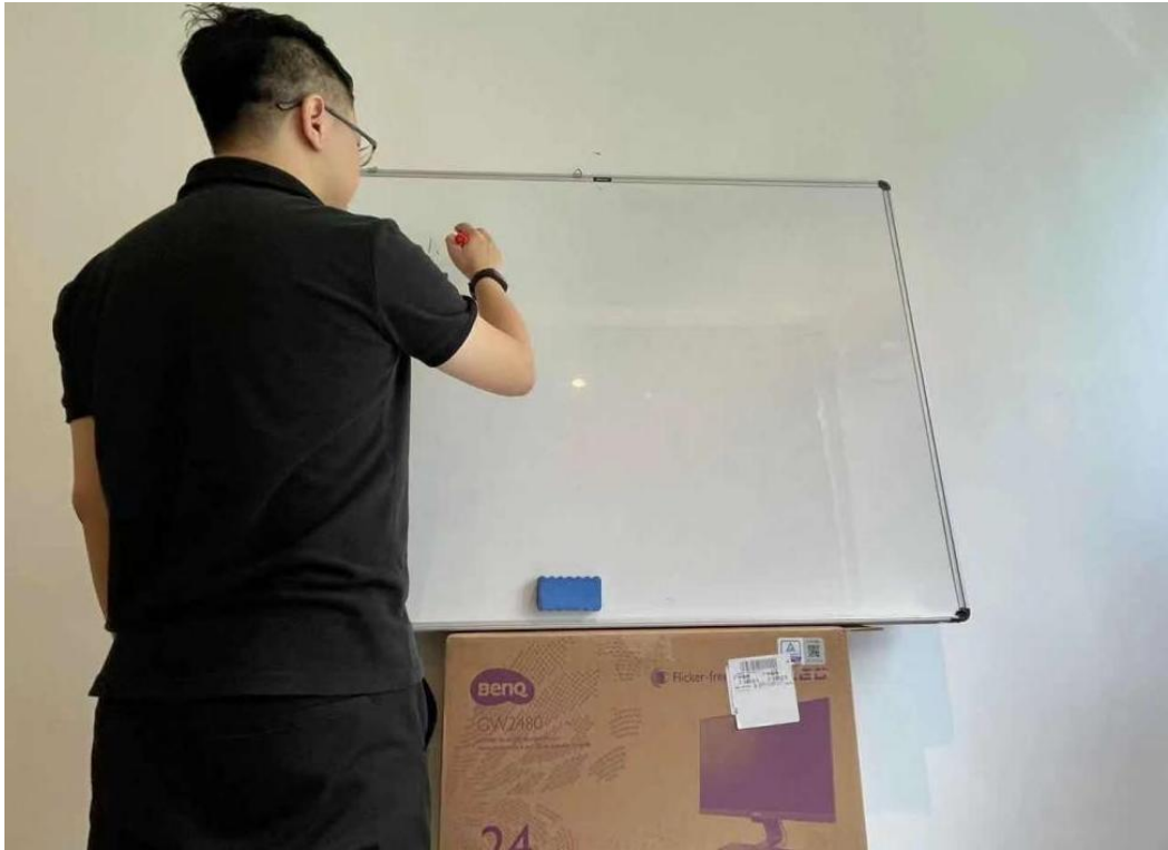
图二：面试电脑端正面视角